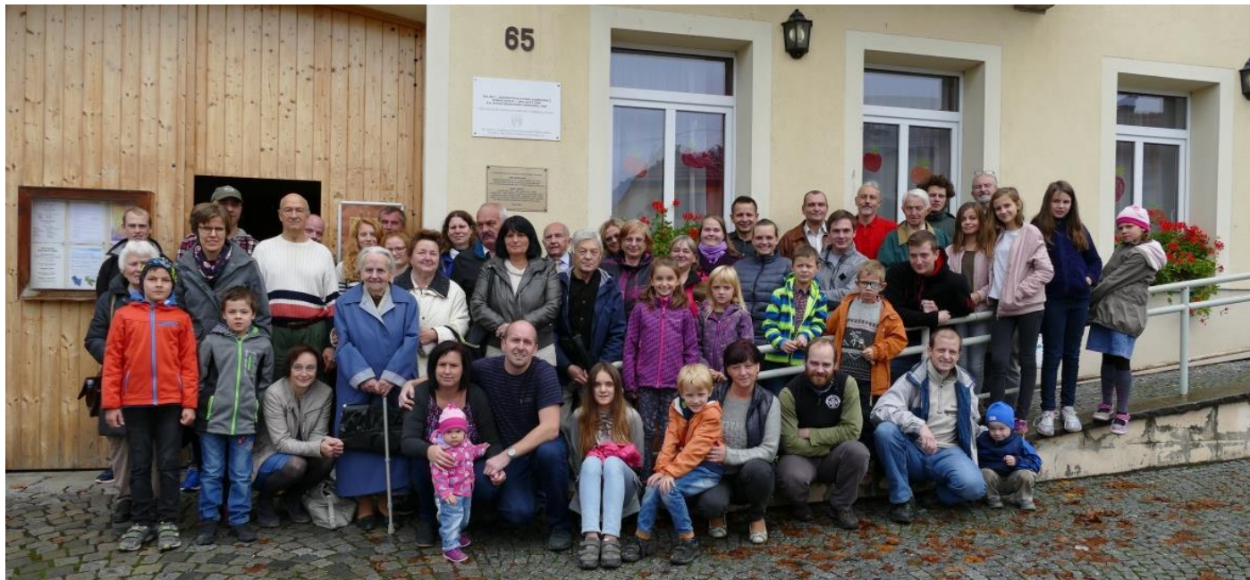
Obrázek 6: Obrázek 6: Účastníci nedělního shromáždění (říjen 2017)